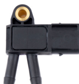
Capteur, pression des gaz échappement