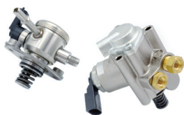
Pompe haute pression