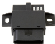
Dispositif de contrôle, pompe à carburant