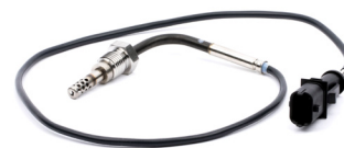
Capteur température échappement