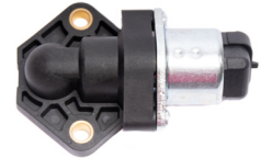
Soupape réglage ralenti