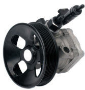
Pompe hydraulique, direction